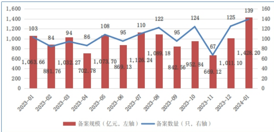
图1 ABS产品每月备案规模及数量变化趋势

2024年1月，企业资产证券化产品共备案确认139只，新增备案规模合计1,428亿元（见图1）。1月新增备案规模环比增长41%，同比增长34%。